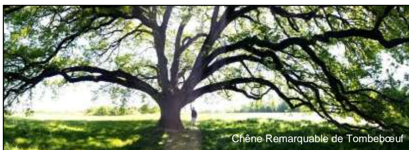
Chêne Remarquable de Tombebœuf